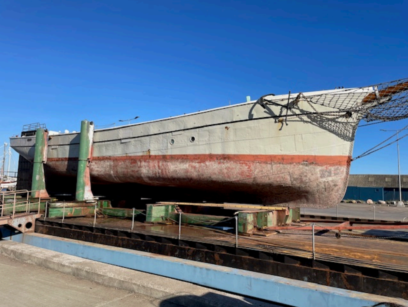
På beddingsvogn i Nexø

D. 20. oktober blev hun hævet og spændingen var stor. Alt gik som smurt en kold og smuk efterårsdag, og hun blev trukket på luftpuder til den store Torpedohal.